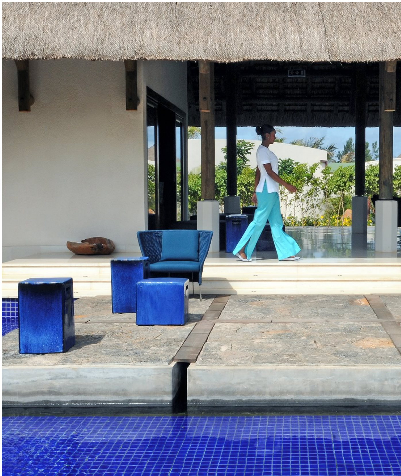
Sofitel So Mauritius - Bel Ombre - Mauritius