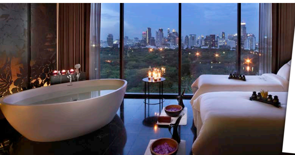
Sofitel So Bangkok - Thailand